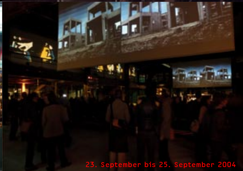
23. September bis 25. September 2004