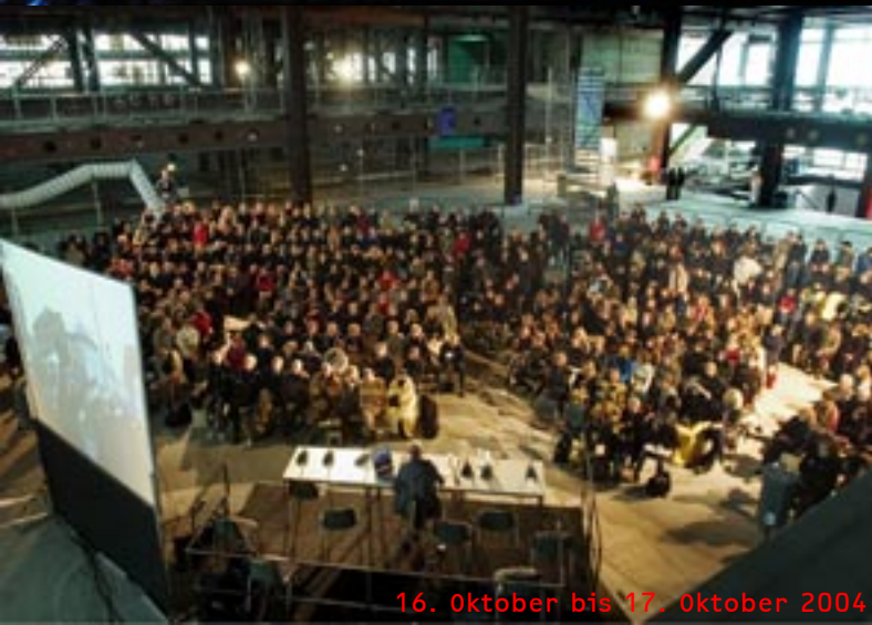
16. Oktober bis 17. Oktober 2004