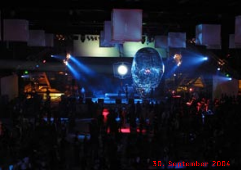
30. September 2004