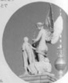
宮殿の礎、勝利の女神

着手にはたっ広い場所が見える が、これが美術館の礎。ここには 1900年までアルプス山脈では最大 の規模を持つ豪華なベルリン宮殿 が建っていた。プロイセンを象 徴する建物であった宮殿は、軍用 パレードの場所を作るため壊壊して 取り壊される運命となった。現在は 再建の費用について議論が沸騰してお り、元の外観を再現して多目的ホール として復興するかどうか、まだ決着がついて いない。