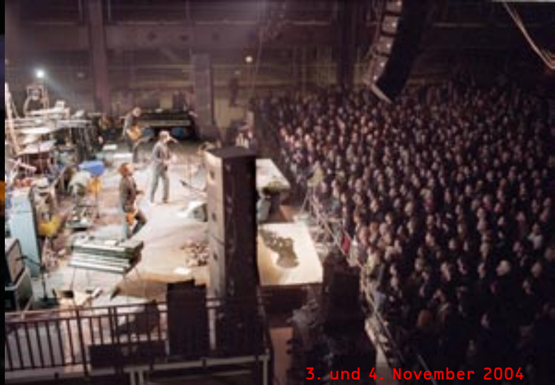
3. und 4. November 2004